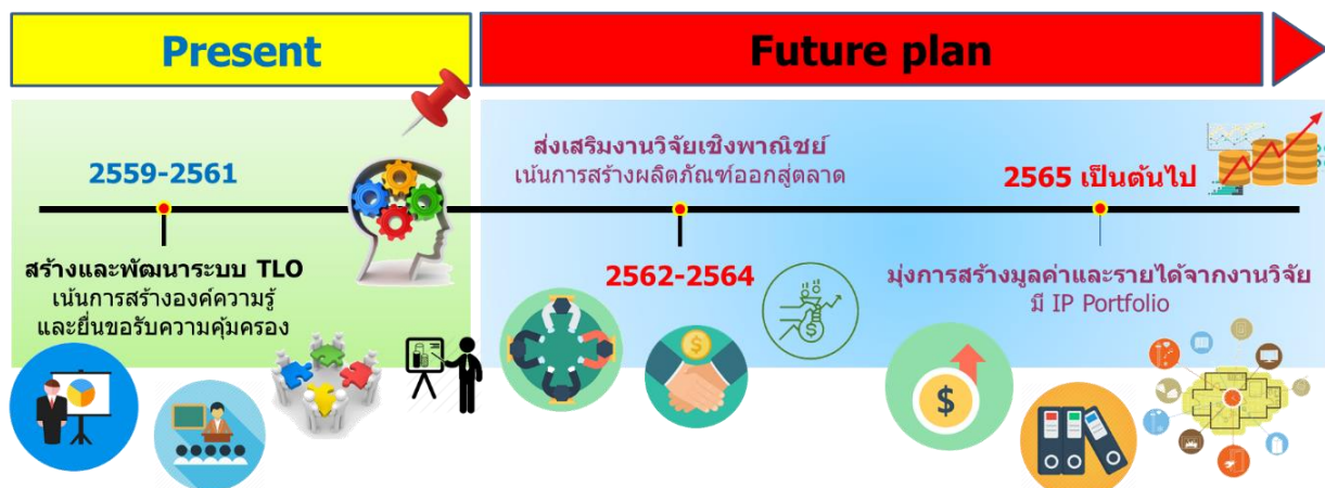
ภาพฉายการดำเนินงานด้านทรัพย์สินทางปัญญา มหาวิทยาลัยทักษิณ